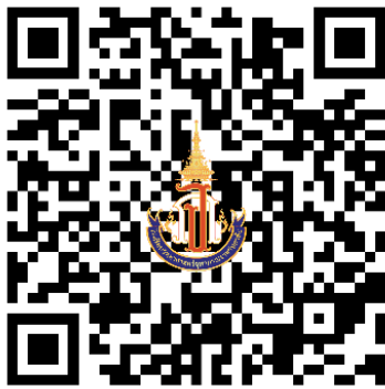
กรอกข้อมูลเพื่อมอบตัวและทำสัญญาฯ

สแกน QR Code เพื่อกรอกข้อมูลสำหรับสัญญาการเป็นนักเรียนโรงเรียนวิทยาศาสตร์จุฬาราชวิทยาลัย ตรัง ระดับชั้นมัธยมศึกษาตอนต้น ปีการศึกษา 2568