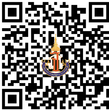
กรอกข้อมูลเพื่อมอบตัวและทำสัญญาฯ

สแกน QR Code เพื่อกรอกข้อมูลสำหรับสัญญาการเป็นนักเรียนโรงเรียนวิทยาศาสตร์จุฬาราชวิทยาลัย ตรัง ระดับชั้นมัธยมศึกษาตอนต้น ปีการศึกษา 2568