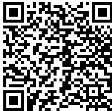
รายละเอียดการมอบตัวและทำสัญญาฯ ม.4

สแกน QR Code เพื่อกรอกข้อมูลสำหรับสัญญาการเป็นนักเรียนโรงเรียนวิทยาศาสตร์จุฬาราชวิทยาลัย ตรัง ระดับชั้นมัธยมศึกษาตอนปลาย ปีการศึกษา 2568